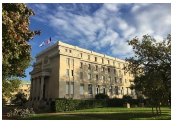
To κτίριο της Fondation Hellénique