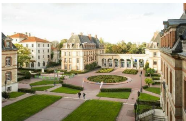
To campus της Cité Internationale

Η Fondation Hellénique βρίσκεται μέσα σε ένα πάρκο 34 εκταρίων στο Παρίσι και έχει άριστη πρόσβαση στα μέσα μαζικής μεταφοράς. Το πάρκο λειτουργεί ουσιαστικά ως υπαίθριο μουσείο που παρουσιάζει την αρχιτεκτονική του 19ου και 20ου αιώνα, με κτίρια που έχουν σχεδιαστεί από διάσημους αρχιτέκτονες όπως οι Le Corbusier, Lucio Costa, Claude Parent, Dudock και άλλοι. Το Ελληνικό Σπίτι, που σχεδιάστηκε από τον αρχιτέκτονα Νικόλαο Ζάχο κατά την περίοδο του μεσοπολέμου, συνδυάζει άψογα νεοκλασικά στοιχεία με επιρροές Art Deco. Τα δωμάτιά του, που ανακαινίστηκαν πλήρως το 2021, διαθέτουν ατομικά μπάνια και μικρές κουζίνες.