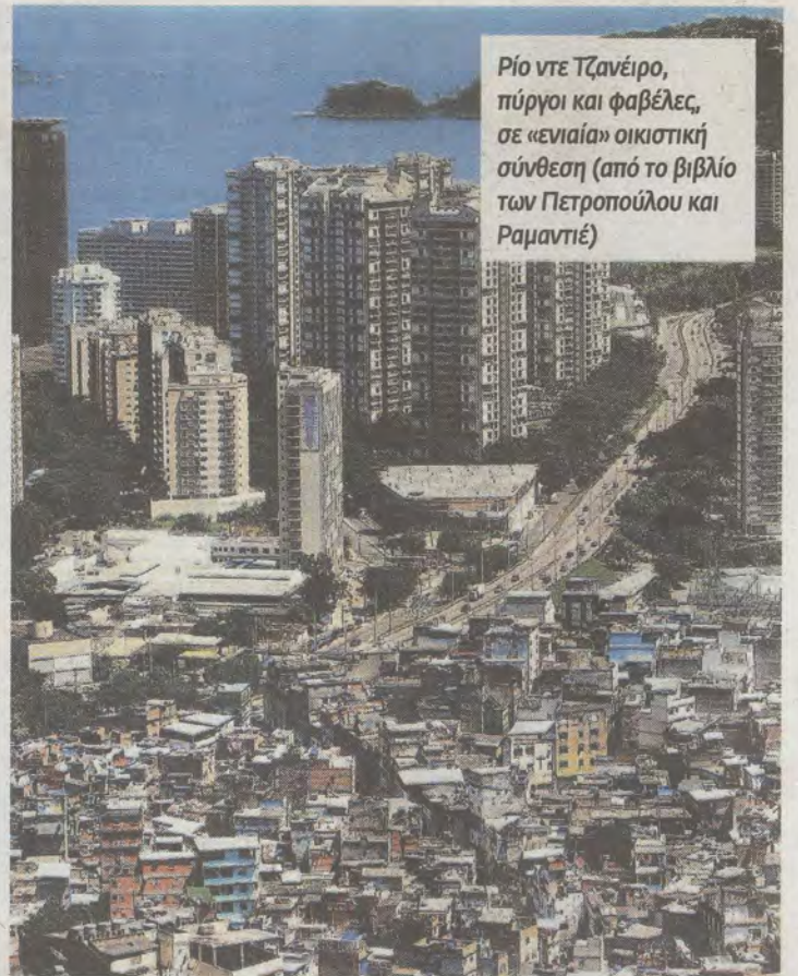
Ρίο ντε Τζανέιρο, πύργοι και φαβέλες, σε «ενιαία» οικιστική σύνθεση (από το βιβλίο των Πετροπούλου και Ραμαντιέ)