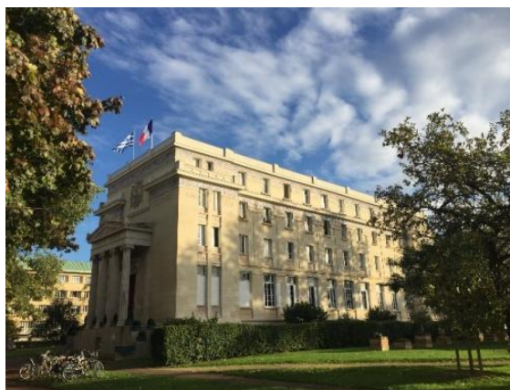
ΤΟ ΕΛΛΗΝΙΚΟ 'ΣΠΙΤΙ'