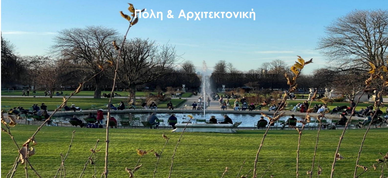
Jardin des Tuileries, Paris, Décembre 2022