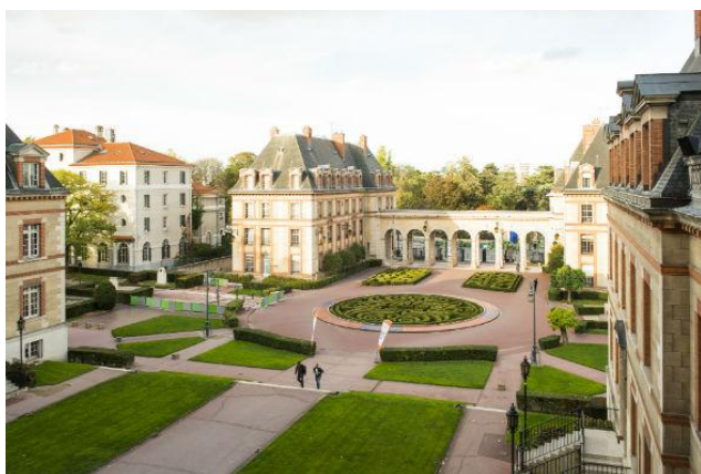
Η CITE UNIVERSITAIRE

Η Fondation Hellénique βρίσκεται μέσα σε ένα πάρκο έκτασης 34 εκταρίων μέσα στην πόλη του Παρισιού και διαθέτει επαρκέστατη σύνδεση με τα ΜΜΜ (Μέσα Μαζικής Μεταφοράς). Το πάρκο ουσιαστικά είναι ένα υπαίθριο μουσείο αρχιτεκτονικής του 19 ου και του 20 ου αιώνα με κτήρια διασήμων αρχιτεκτόνων όπως ο LeCorbusier, Lucio Costa, Claude Parent, Willem Dudok κ. ά. Το «ελληνικό «σπίτι», έργο του αρχιτέκτονα Νικολάου Ζάχου, κατασκευασμένο την περίοδο του μεσοπολέμου συνδυάζει στοιχεία του νεοκλασικισμού μαζί με αναφορές στην αρ ντεκό. Τα δωμάτιά του, πλήρως ανακαινισμένα το 2021, διαθέτουν ατομικά λουτρά και κουζίνες.